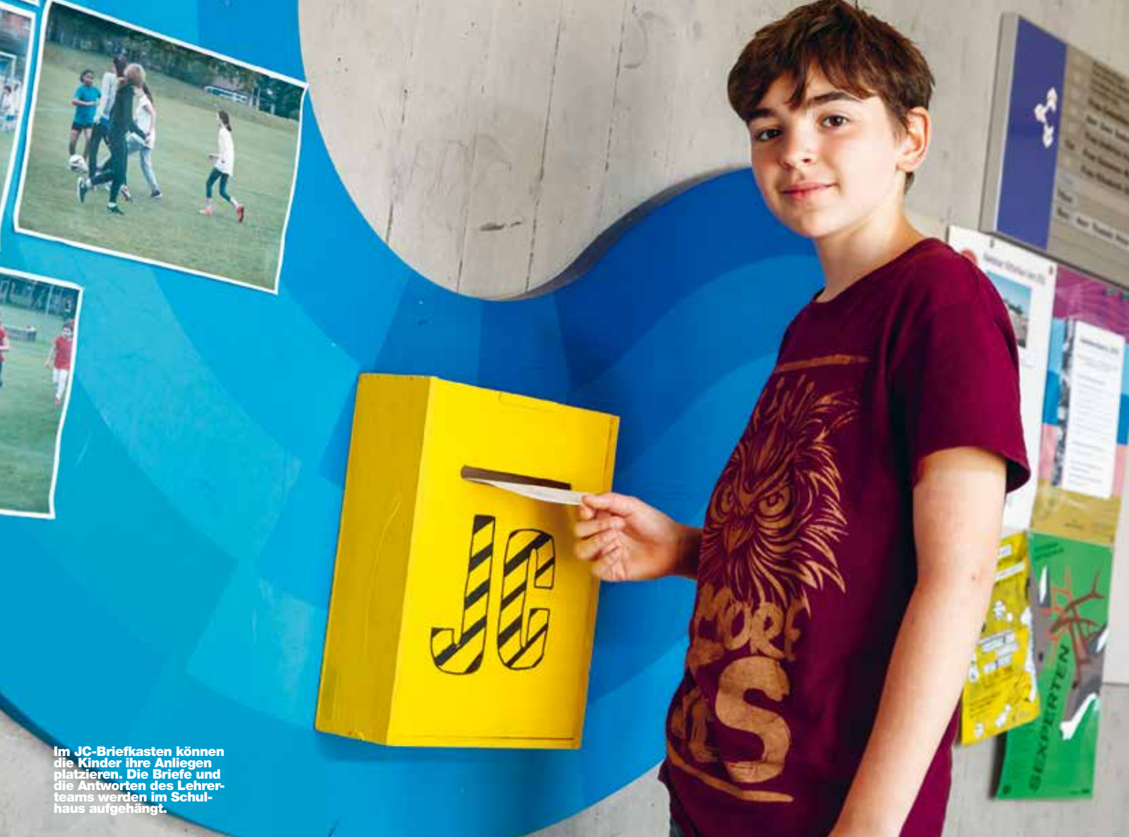
Im JC-Briefkasten können die Kinder ihre Anliegen platzieren. Die Briefe und die Antworten des Lehrerteams werden im Schulhaus aufgehängt.

heisst halt für jeden etwas anderes. Dagegen sind die organisatorischen Fragen Peanuts.»